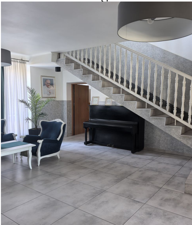
To są drzwi do Sekretariatu