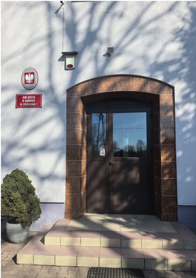
To jest wejście do Domu Dziecka w Dąbrówce Drzwi do sekretariatu są pod schodami