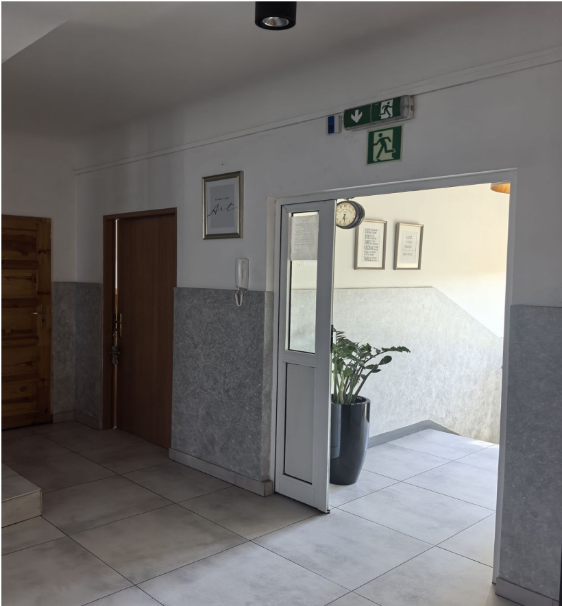
To są drzwi do gabinetu dyrektora